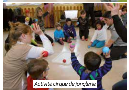
Activité cirque de jonglerie