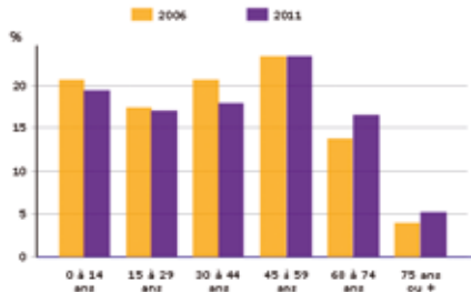
PDP G2 - Population par grandes tranches d'âges