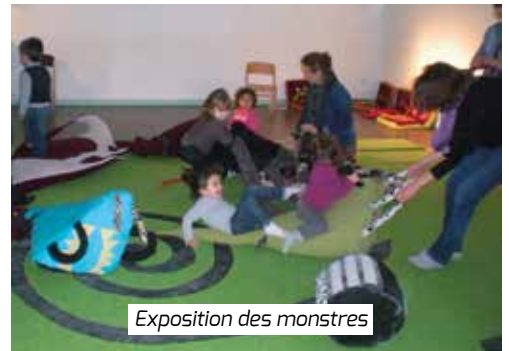
Exposition des monstres