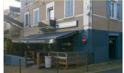
Restaurant Il Villagio

La municipalité a défini un périmètre de protection du commerce et de l'artisanat. Dans ce cadre, elle a acheté le fonds de commerce "Bar et petite restauration" situé rue du Sillon, maintenant dénommé "IL VILLAGIO". Elle loue les murs à la SCL qui est propriétaire de l'immeuble.